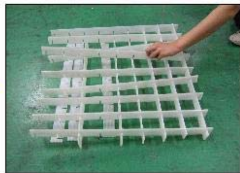
一部が外れると、すぐにバラバラになってしまい、再使用時に組み直しの手間が発生します。