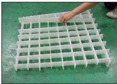
持ち上げると、一部が外れてしまいます。