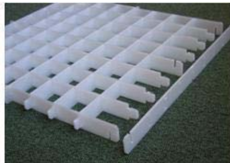
組み込み後は外れない構造に改善。