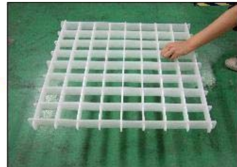
持ち上げても、一部が外れることはありません。横にしても、通常作業ではバラバラになることはありません。