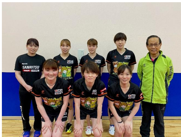
Quo カードなどのノベルティやサンリツ卓球部のユニフォームに活用予定